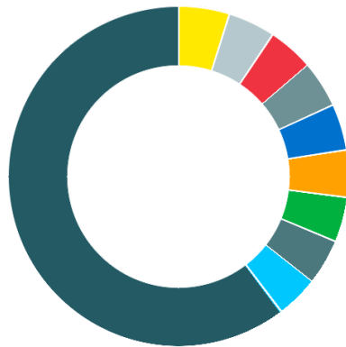
Struktur nach Top-Holdings