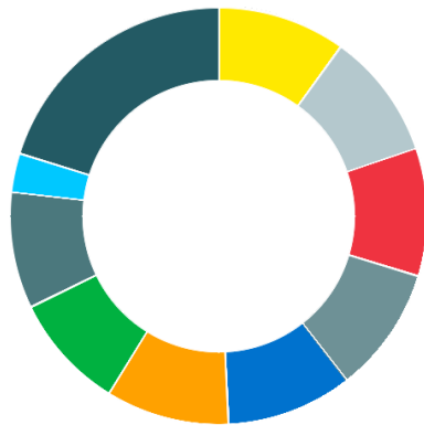
Struktur nach Top Holdings